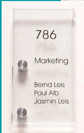
TOSCANA Türschild Größe: 90x170 mm 2-Loch-Ausführung