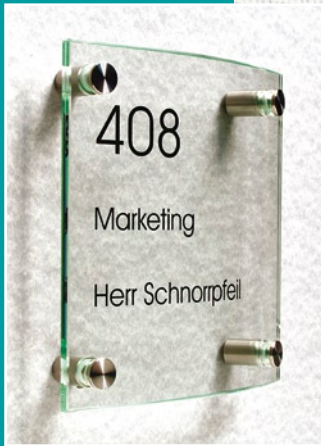
TOSCANA Türschild Größe: 150x150 mm 4-Loch-Ausführung, Glas leicht gewölbt