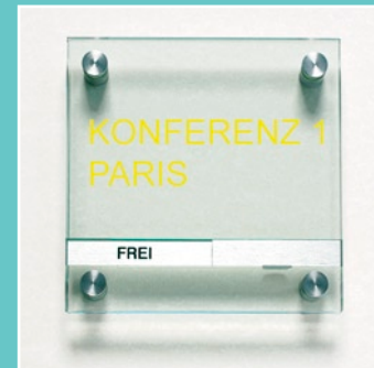
TOSCANA Türschild mit FREI/BESETZT-Anzeige Größe: 150 x 150 mm