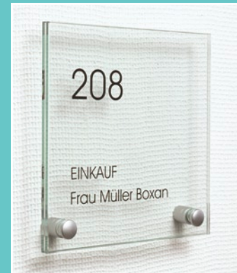
TOSCANA Türschild in verschiedenen Größen lieferbar, 2- oder 4-Loch- Ausführung