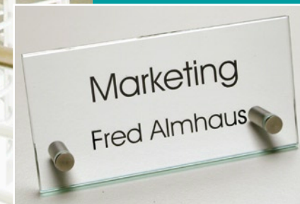
TOSCANA Tischaufsteller aus Echtglas Größe: 200 x 100 mm

Die Türschilder der Serie TOSCANA bestehen aus zwei Echtglasscheiben mit geschliffenen und facettierten Kanten. Die Scheiben werden durch vier Abstandshalter aus Edelstahl gehalten.